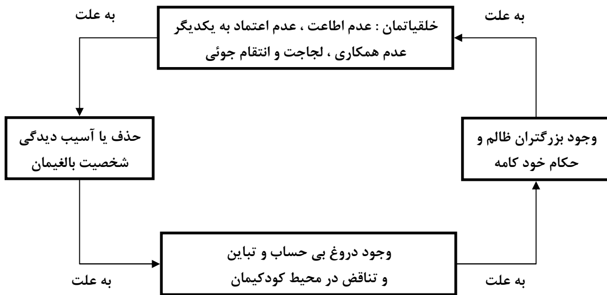
شکل (۱) اوضاع سیاسی و فرهنگی جامعه ما، قرن هاست که زنجیر بسته ای را تشکیل می داده

بدین خاطر در مواقع روبروئی با دیگرانی که آشنائی و دوستی نداریم تا حالتِ رفاقتی شخصیت ۵ حاکم بر وجودمان شود، همیشه - برحسب موقعیت - یا از موضع حالتِ والدینی شخصیت با او وارد گفتگو می شویم و شخص ثالثی را مورد حمله قرار می دهیم؛ یا خود را بالاتر از طرف می دانیم و آمرانه از موضع فرادستی می خواهیم به او تحکم کنیم. و یا اگر مخاطبمان را صاحب زور و قدرت و مقام و ثروتی تشخیص داده و یا به هر علتی برایش شخصیتی والا قائل شده ایم، بلافاصله پائین آمده، در حالتِ کودکی شخصیت قرار می گیریم و با احساس حقارت، از موضع فرودستی، هر نوع تحمیلی را پذیرا و عندالاقضا مجیزگوئی می کنیم. در آنجا سعی کردم با مثال هائی از صحنه های هر روزی زندگیمان و شرح سرگذشت برخی از بزرگان مملکت و رفتار توده های مردم در مواقع عیدیه حیات اجتماعی مان دلائلی در تأیید فرضیه ام ارائه دهم. فرضیه اینک: « درد اساسی و شاید بزرگترین علتِ عقب افتادگی هایمان و عامل مؤثر تسلط دیکتاتورها در طول زمان بر تمام شؤون زندگیمان، داشتن چنین خلقیاتی بوده است. وجود چنین خلقیاتی، خود ناشی از آسیب دیدگی یا حذف حالتِ بالغی شخصیت مان و این نقص به علت وجود دروغ زیاد و تناقض و تباین های رایج در محیط رشد دوران کودکیمان و وجود دروغ و کژیها اکثراً به خاطر ترس از ظلم بزرگترهایمان بوده است که به سلسله مراتب از خانه شروع و به حکام خود کامه ختم می شده است.» در حقیقت اوضاع سیاسی و فرهنگی جامعه ما، زنجیر بسته ای را تشکیل می داده که دوام و قوام نظام استبدادی را از قرن ها پیش ممکن ساخته است. شکل (۱)